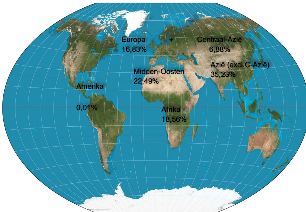
Figuur: Doelbesteding van TWR Nederland & België in 2023 naar regio

TWR Nederland & België heeft gekozen voor de doelgebieden Afrika, het Midden-Oosten, Europa en Azië. Nederland zelf (sinds 2010) en België (sinds 2014) zijn ook weer doelgebieden van TWR Nederland & België. In 39 verschillende landen worden projecten ondersteund vanuit TWR Nederland & België. De verdeling van de afdrachten over de verschillende regio's is als volgt: